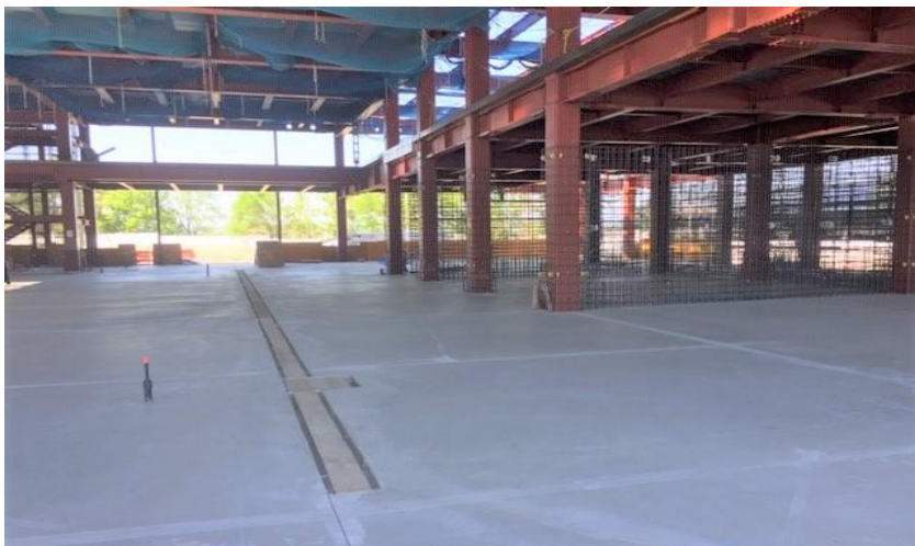
(1) リサイクル施設：1階土間コンクリート打設後