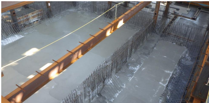
(5) 熱回収施設：ごみピット底盤コンクリート打設後