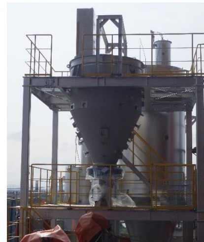
(8) 熱回収施設：飛灰貯留槽据付中