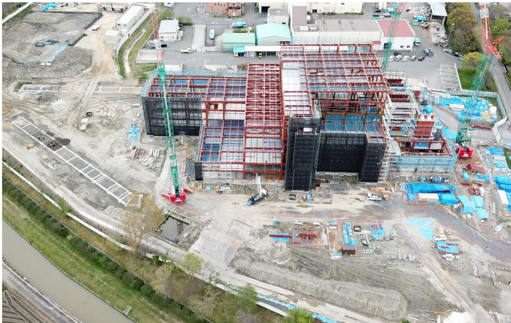
令和2年4月（2020年4月）の工事状況 4月22日撮影