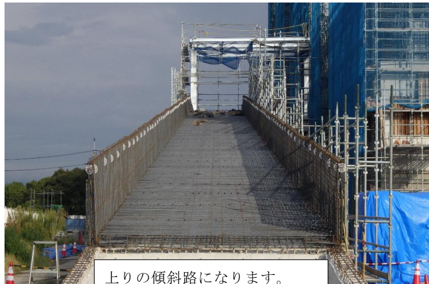
(2) 熱回収施設：ランプウェイ（北側）配筋工事