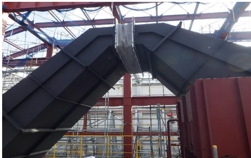
(5) 熱回収施設：ボイラとエコノマイザの接続ダクト組付