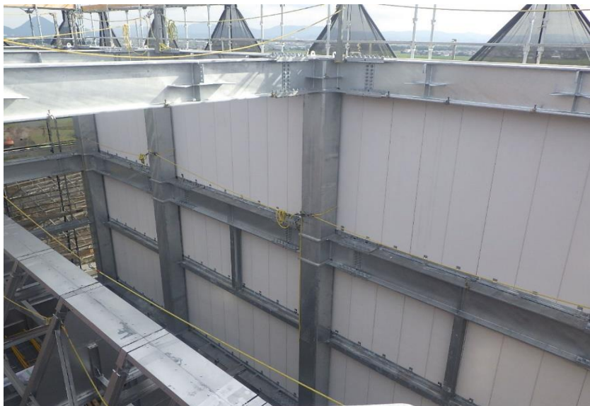
(1) 熱回収施設：ALC 工事（蒸気復水器室）