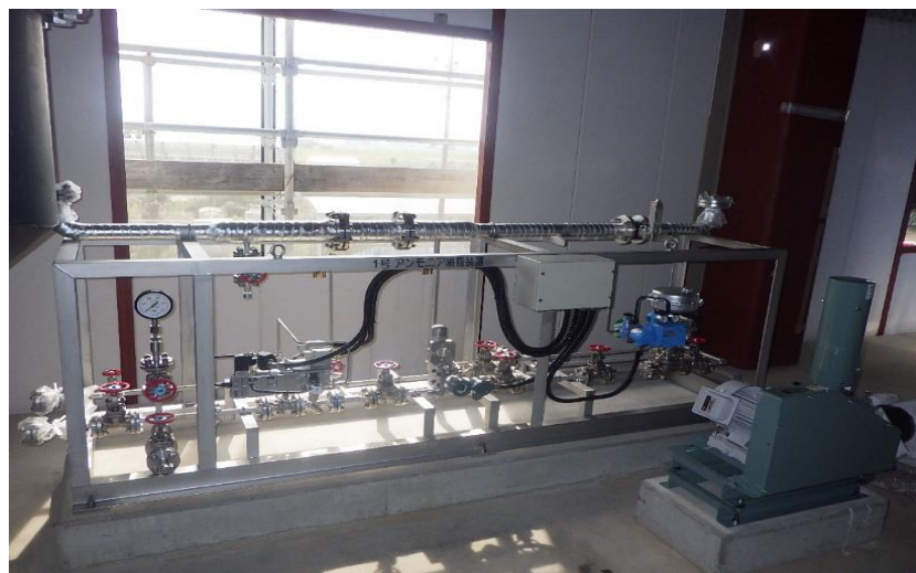
(6) 熱回収施設：アンモニア噴霧装置据付