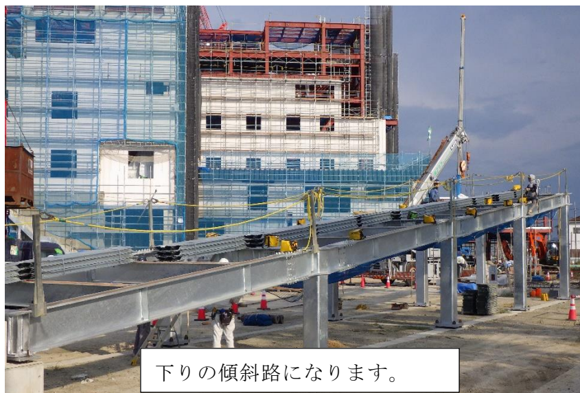
(3) 熱回収施設：ランプウェイ（南側）鉄骨工事