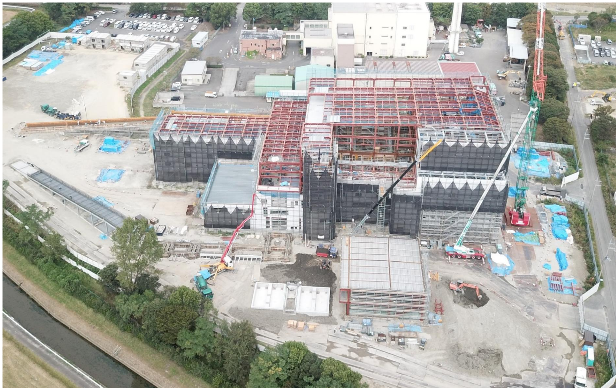
令和2年9月（2020年9月）の工事状況 9月24日撮影