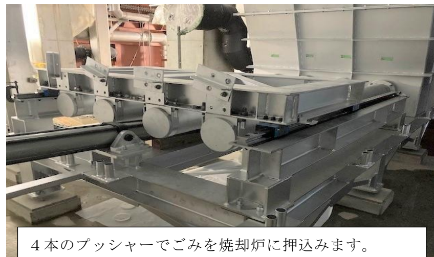
(8) 熱回収施設：給じん装置据付