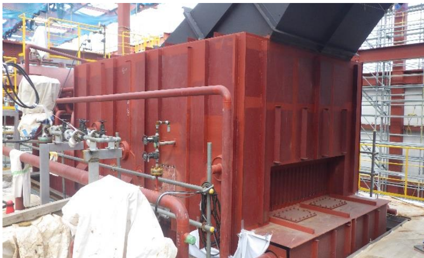
(5) 熱回収施設：ボイラケーシング取付け