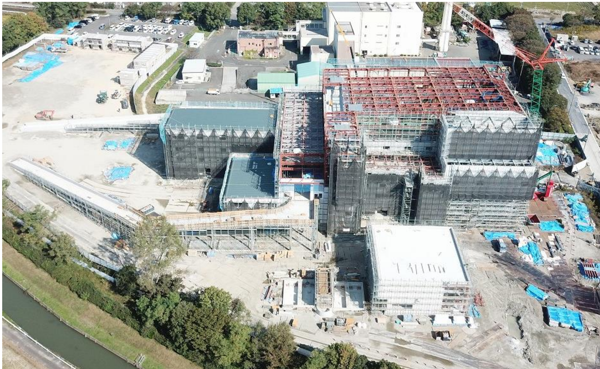
令和2年10月（2020年10月）の工事状況 10月31日撮影