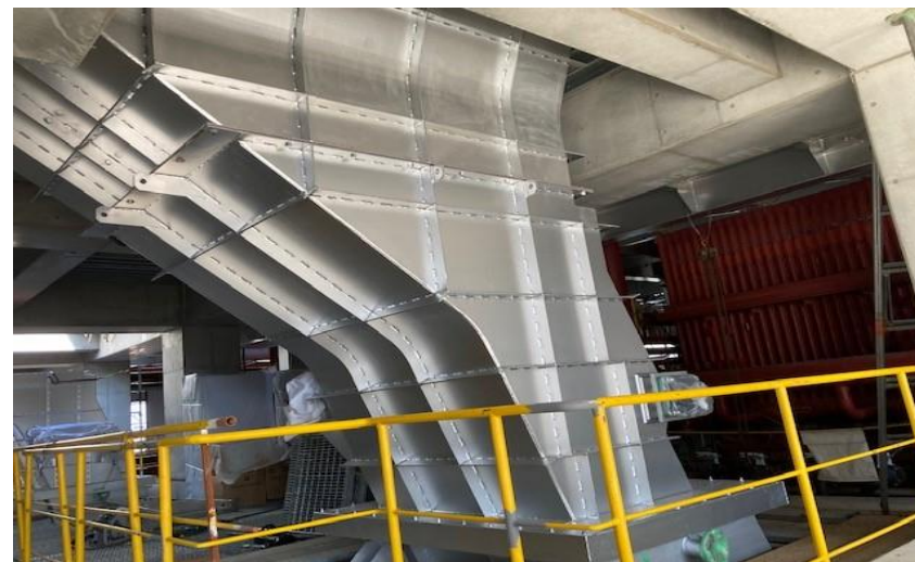
(6) 熱回収施設：給じんシュート据付