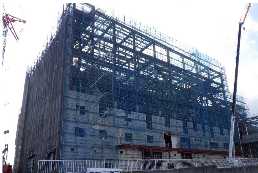
(1) 熱回収施設：ALC 工事（外壁）