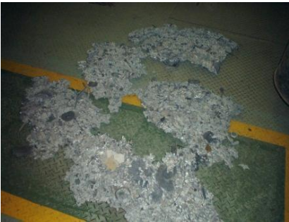
底部に付着していた 溶けたアルミの塊