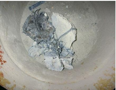
底部から取り出した鉄 類など