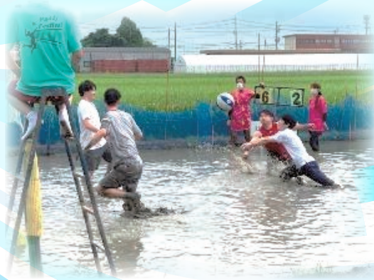
もりやま青年団の活動