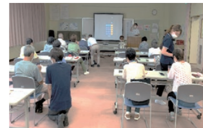
社会教育（スマホ体験講座）