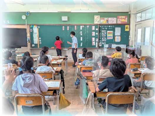
守山式授業ベーシックステップの推進