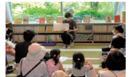
本の読み聞かせ（図書館）