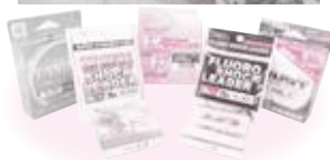
①山豊テグス社屋 ②紡糸工場内 ③工場で生まれた商品

昭和元年に家内工業として創業。昭和38年6月に法人化して60年になる、老舗釣り糸専門メーカーです。釣り糸専門といっても、素材や太さ、用途などに合わせて約200種類を製造しています。