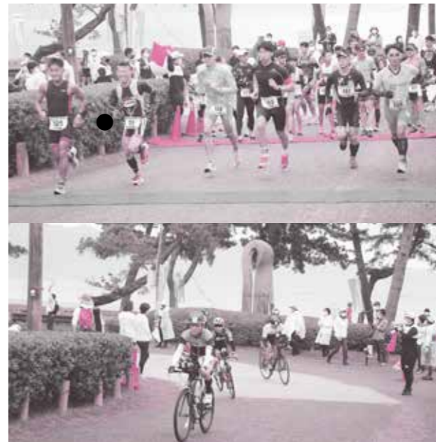
昨年のデュアスロン大会

LAKE BIWA TRIATHLON IN MORIYAMA 実行委員会事務局 ☎080(8245)0374(平日午前9時～午後6時。大会当日は終日)