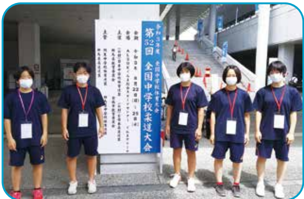
女子柔道(順不同・敬称略)

このうち市立中学校では、守山中学校の女子柔道部と男子ソフトテニス部が、ベスト16の優秀な成績をおさめました。