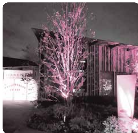
市立図書館でオレンジライトアップ

また、認知症への理解促進のため、市立図書館でオレンジライトアップ〔9月17日(金)～23日(木・祝)〕と、認知症関連本やグッズの展示〔9月30日(木)まで〕を行います。