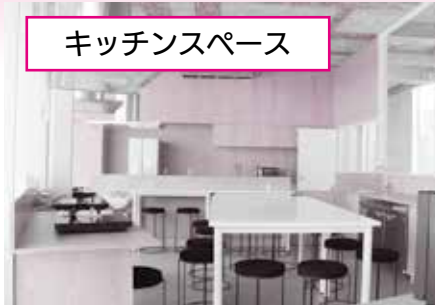
キッチンスペース

落ち着いた空間でゆったり学習や読書ができます。本棚には環境関連書籍や漫画などを蔵書しています