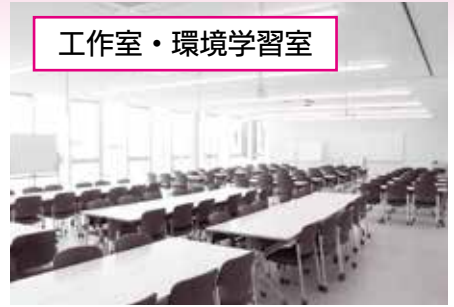
工作室・環境学習室

工具や工作機械を完備し、ろくろで陶芸ができます。会議や講演会などでも利用できます