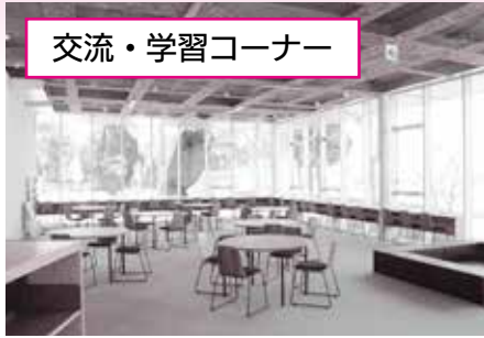
交流・学習コーナー

落ち着いた空間でゆったり学習や読書ができます。本棚には環境関連書籍や漫画などを蔵書しています