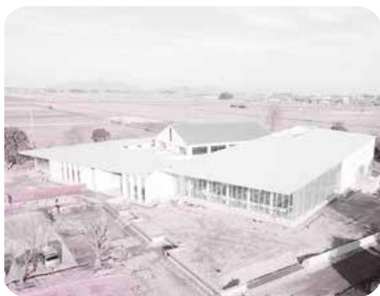
交流拠点施設(1月25日撮影)