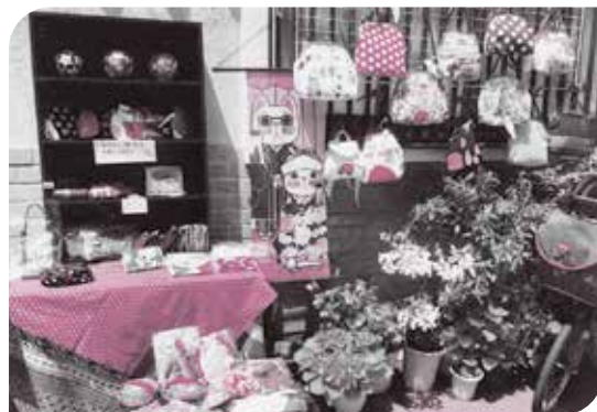
イベントなどで布あそびの成果品を展示