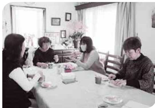
少人数で励まし合いながら自粛中(取材時)

困難な状況をポジティブに乗り切る提案のマスク展はメディアにも取り上げられ、驚きの反響を呼びました。当初の目標として100枚のマスクを展示していましたが、会場から「商品がなくなる」と連絡を受けては作って持参し、400枚以上のマスクを作り、ほとんど売れてしまうほどの人気でした。