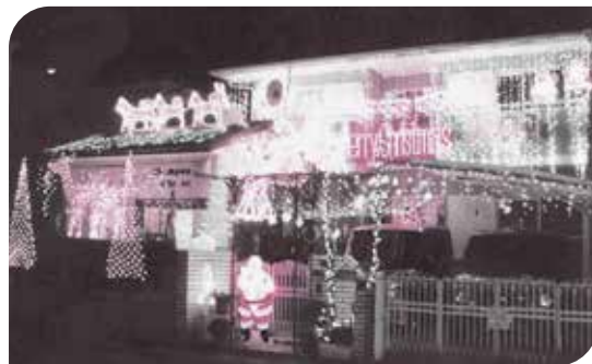
「みんな元気に」の願いを込めたイルミネーションの活動もしていました(東日本大震災以降は中止しています)

が義務にならないよう自治会の各種団体にはなっていないと。青春18切符で旅行をしたり、クリスマス会を開いたり、「楽しい」を追求しながら、夏祭りなど自治会行事の協力もします。その中の、特に手芸好きな仲間が集まって、平成25年に「たんぼぼくらぶ」が誕生しました。メンバーは2つのクラブで活動を楽しく、仲間の絆と地域力を高めています。