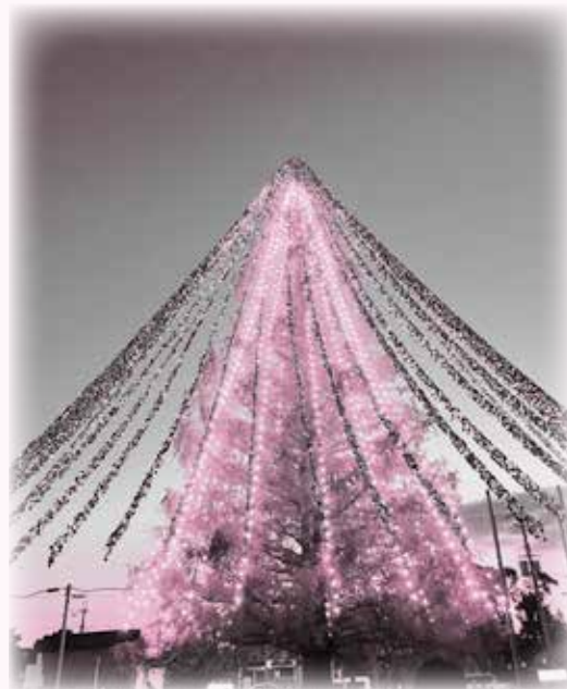
当日は、51,626枚のメッセージカードが飾り付けられました。巨大なイルミネーションに集まったメッセージカードがきらきらと輝いて、師走の夜空を明るく照らしていました。