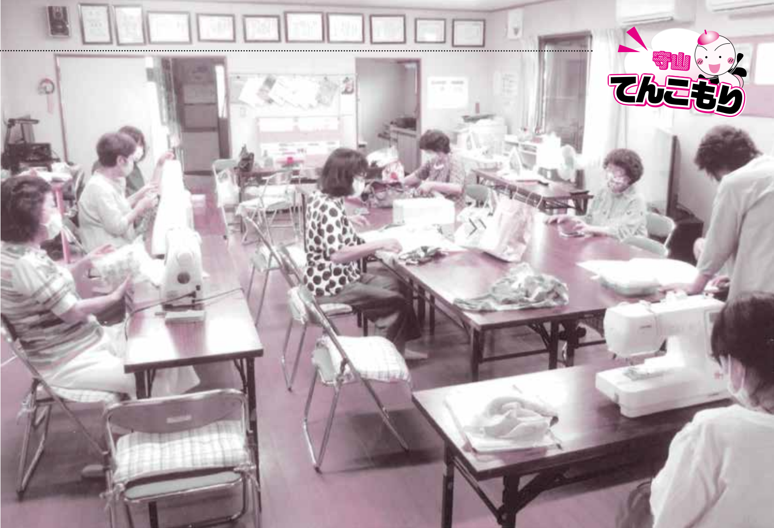
大鳥自治会館に集まって手芸を楽しむたんぽぽくらぶの様子(現在自粛中)