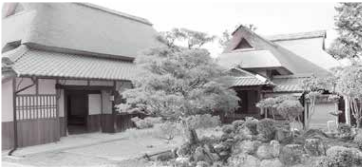
大庄屋諏訪家屋敷