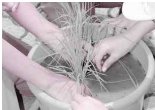
田植えでは泥田の感触を体験