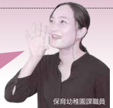
保育幼稚園課職員

園の仕事が未経験でも、blankがあっても私たちがしっかりサポートをします。子どもたちの成長を守るために、あなたの力を貸してください。