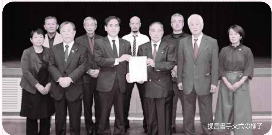
提言書手交式の様子