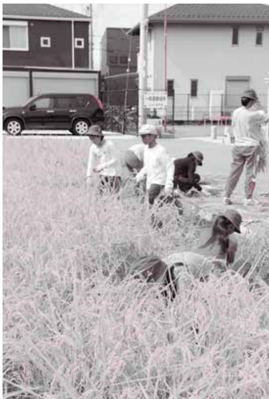
学習田で稲刈りを楽しむ児童(昨年写真)

新型コロナウイルス感染症の影響を受けて、学習田の代わりにバケツ田んぼで米づくりを体験