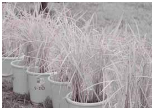
バケツ田んぼにも実りの秋