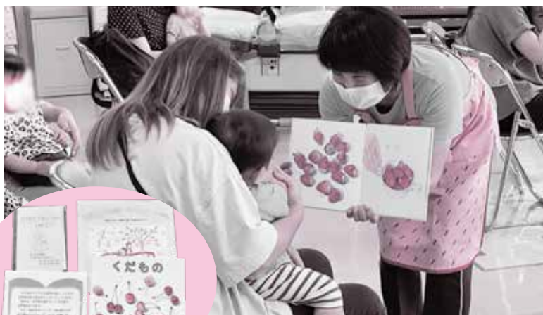
↑10ヵ月児健診での読み聞かせ ←プレゼントの絵本

本市では、乳幼児期からの積極的な本との出会いの場の創出と、「こどもの育ち」を推進するため、10ヵ月児健康診査で保育士による絵本の読み聞かせと絵本のプレゼントを行っています。