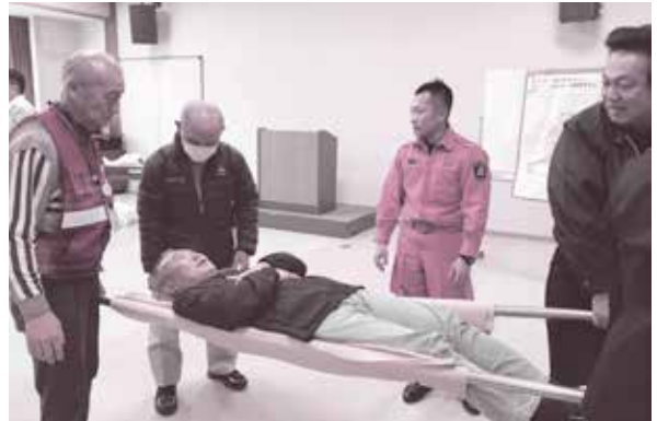
男性団員交流会の様子

守山市社会福祉協議会 ☎(583)2923 (日本赤十字社滋賀県支部守山地区事務局)