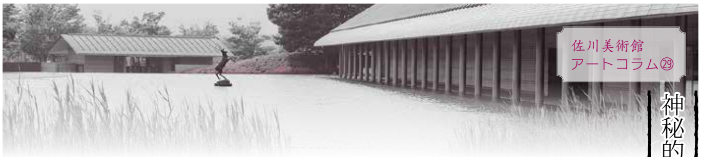
佐川美術館 アートコラム⑨