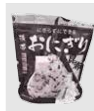
来場者に非常食を進呈します

実行委員会事務局(人権政策課内) ☎・📠(582)1116 📠(582)0539