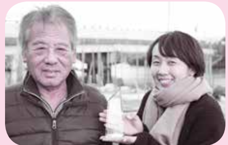
トロフィーを手を受賞を喜ぶ生産者(玉津小津漁業協同組合、chocomaka)

赤野井湾にて寄附者が核入れから取り出しを行う体験型の返礼品で、真珠の育成の3年間、真珠の育ちや琵琶湖の環境を生産者と同じ気持ちで過ごすことができる取り組みである点が評価されました。詳しくは市ホームページをご覧ください。今後もふるさと納税を通じて全国へ守山市の良さを発信します。