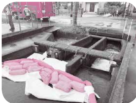
河川に流入した油をせき止める様子