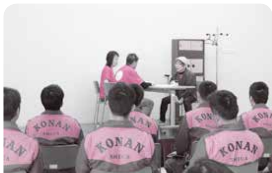
消防署で行った認知症サポーター養成講座の様子

「認知症サポーター養成講座」は10人程度集まれば開催できます。詳しくは下記へお問い合わせください。