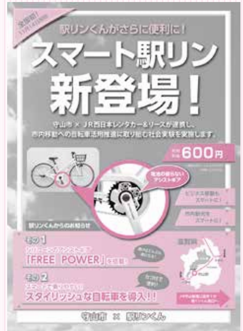
③シリコンの反発力を動力に変換