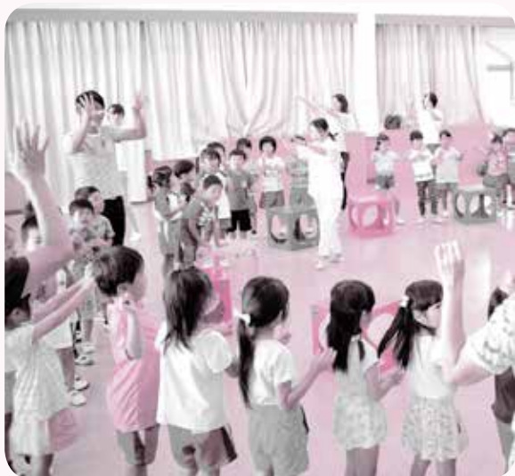
守山音頭の振り付けで「ホタル」を表現する園児たち

守 山音頭は市制誕生(施行)を記念して制作されました。市の50周年を祝って、この音頭を復活させ、広めたいと願い、守山市文化協会の協力のもと、ボランティアの皆さまが市内の園児たちに守山音頭の振り付け(踊り)を伝授しています。