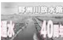
野洲川放水路 通水40周年