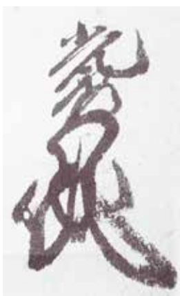
明智光秀花押(県立安 土城考古博物館所蔵 の明智光秀書状より)