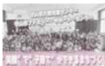
笑顔で子育てができるまちづくり