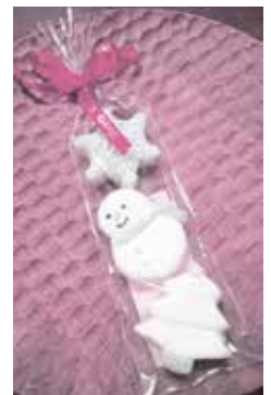
アイシングクッキー (イメージ)