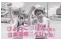
ひょっこりはんと巡る日本遺産スペシャル!