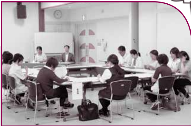
第3回看取りケア研修会