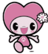
守山市社会福祉協議会 イメージマスコット キャラクター もりびー