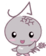
JAおうみ富士 イメージキャラクター おうみん®