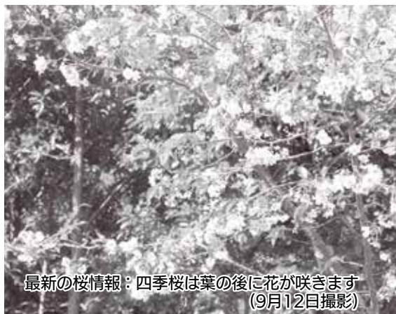
最新の桜情報：四季桜は葉の後に花が咲きます(9月12日撮影)