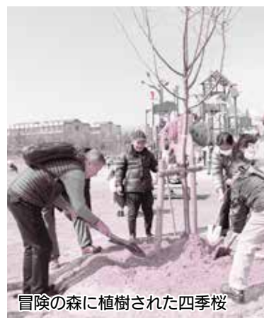
冒険の森に植樹された四季桜