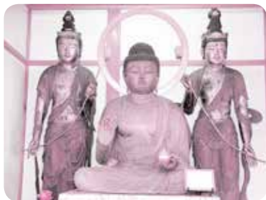
慈眼寺所蔵の薬師三尊(市指定文化祭)