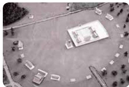
伊勢遺跡を再現したジオラマ

伊勢遺跡は伊勢町、阿村町一帯に広がる、弥生時代後期(紀元後1～2世紀)の集落跡で、近畿地方では最大の集落跡です。