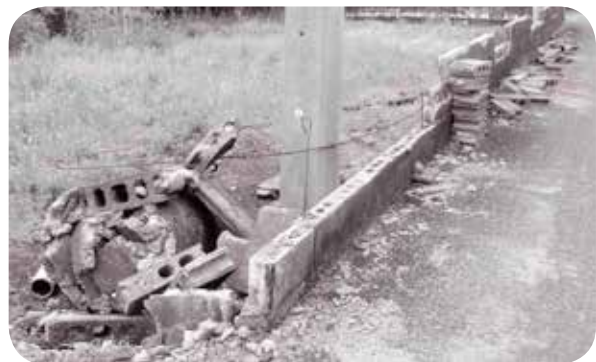
熊本地震で倒壊したブロック塀。こうなる前に早めに安全対策を！