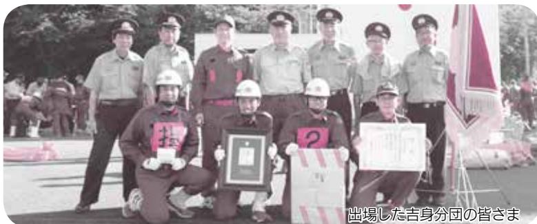
出場した吉身分団の皆さま

地域の皆さんや多くの方々に応援、ご支援していただき、6位入賞という結果を残すことができました。ありがとうございました。今後においても、地域の皆さんの安全・安心のために取り組んでまいります。