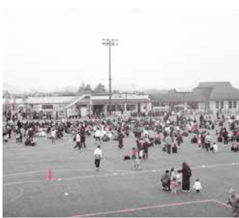
にぎわう野洲川歴史公園サッカー場