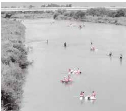
野洲川冒険大会いかだくだりの様子

野洲川放水路の建設に伴い河川としての役割を終えた南流と北流は、放水路の建設で失われた農地の代替地として利用されるとともに、野洲川歴史公園サッカー場やびわこ地球市民の森が整備され、新しい賑わいの場が生まれています。天井川を平地化し農地として利用するため、平地化事業と川砂利を建設用資材として利用する骨材採取事業が平成2年から9年に行われ、新しい農地の造成事業は平成16年に完了しました。