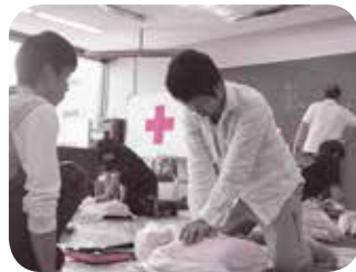
救急法などの講習