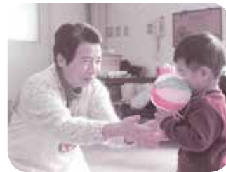
赤十字ボランティア