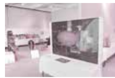
平和のよろこび展