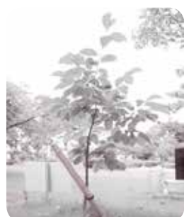
長崎被爆2世柿の木