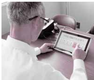
タブレットを使って気軽にもの忘れチェックをしてみましょう

最近「直前のことを忘れるようになった」「よく物をなくしてしまう」など、日常生活の中で、もの忘れが気になる人や家族の様子がおかしいと感じている人は、まずは「もの忘れチェック」を受けてみましょう。「もの忘れ相談プログラム」を使って、気になる「もの忘れ」について確認できます。 「もの忘れチェック」と個別相談は、各地域包括支援センターで随時受けることができますので、お気軽にご相談ください。もの忘れ相談プログラムによるチェックの実施と個別相談での所要時間は1人約30分です。