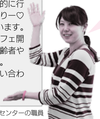
地域包括支援センターの職員