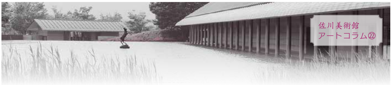
佐川美術館 アートコラム②

自分が主人公になってドキドキハラハラしたり、ことば遊びを繰り返し楽しんだり、たくさんのお話にふれて豊かなイメージでものごとを考える力が育まれているように感じます。これからもさまざまな絵本との出会いを大切に、豊かな心情の育ちにつなげていきたいと思っています。