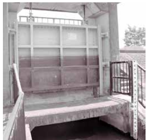
赤野井の樋門の様子