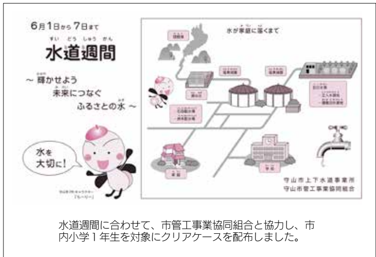
水道週間に合わせて、市管工事業協同組合と協力し、市内小学1年生を対象にクリアケースを配布しました。