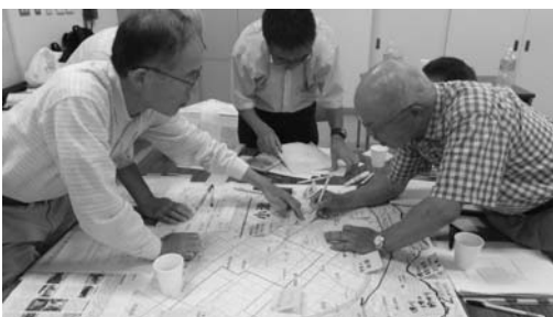
▲話し合いをしている様子です。