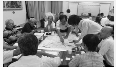
▲テーブル毎に話し合いました