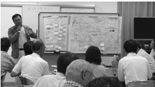
▲発表会を通じて情報を共有化しました。