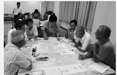
▲テーブル毎に話し合いました