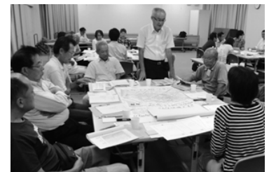
▲話し合いをしている様子です。