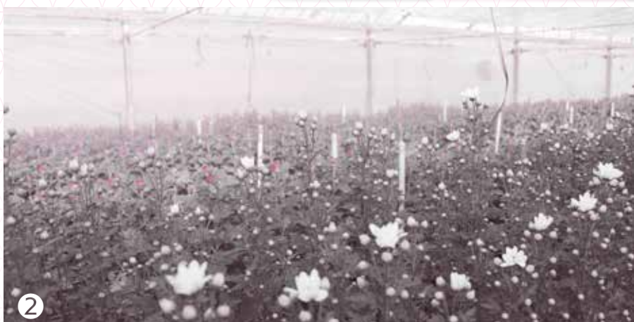
①守山で収穫されたバラ(ローズハウス)②今浜町のキクハウス③④守山で生まれた「わばら」⑤キクのアレンジフラワー

市民の暮らしと田園風景の中でも、たくさんのお花農家がバラやキクを育てています。守山市は県内でも花の栽培が盛んで、JAおつみ富士花 か き園芸振興協会には市内の花農家16人が加入しています。需要がピークを迎える冬、ファーマーズマーケットおつみんちをはじめとする直売所や市場への出荷に向けて、丹精こめて最高の花を育て、収穫に追われている市内の花農家3人に話を伺いました。