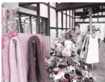
地元特産品や雑貨などの販売