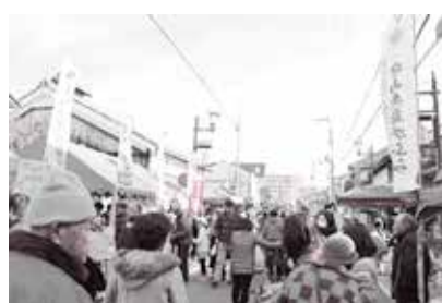
昨年のもりやまいちの様子

問もりやまいち実行委員会事務局(守山商工会議所内) ☎(582)1266 ☎(599)1080