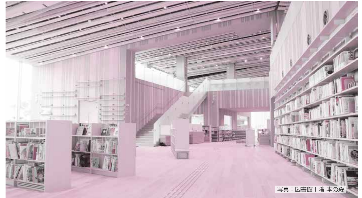
写真：図書館1階 本の森

全館に無料Wi-Fi(Biwako Free Wi-Fi)を整備。タブレット端末も貸出用として用意しています。また、過去30年分の新聞、雑誌の記事などが検索できるデータベース(日経テレコン)も導入します。