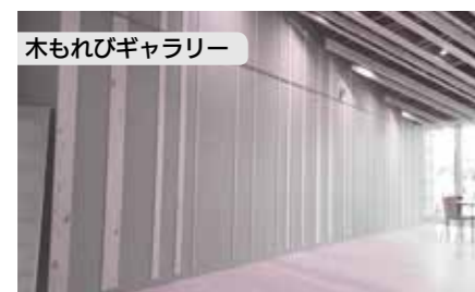
木もれびギャラリー