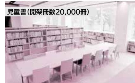
児童書(開架冊数20,000冊)