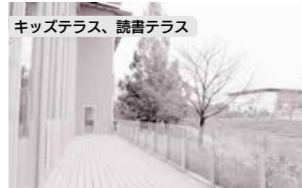
キッズテラス、読書テラス

読み継がれている名作から、最近の人気作まで幅広い児童書を揃え、図鑑や事典類なども豊富です。