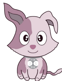
行政相談のマスコット キャラクター 「キクーン」