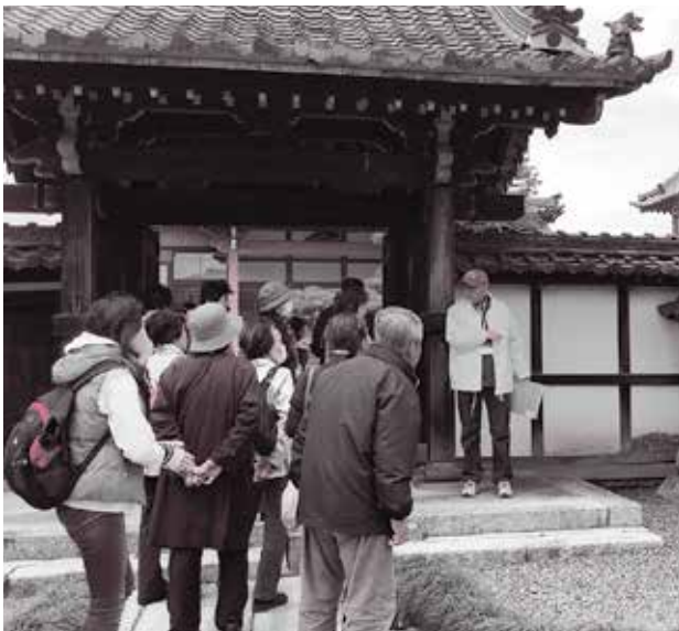
普段の活動の様子