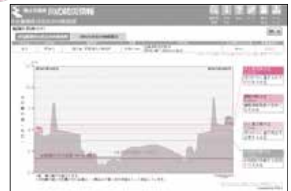
各観測所におけるリアルタイムの川の水位と水位変化を見ることができ、氾濫の危険度がわかります