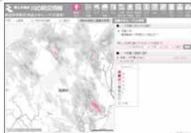
高性能のレーダ雨量や観測における降雨量を見ることができます