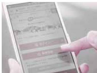
自分の情報を登録してチャレンジスタート