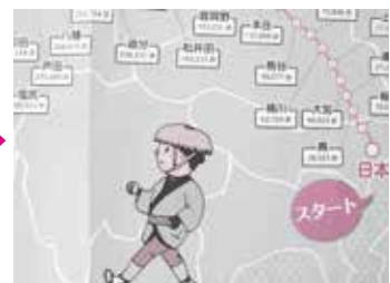
記録した歩数に応じてマップを進める

中山道の中間地点(藪原宿)に到達した方には500円分の商品券を、中山道踏破者には、さらに500円分の商品券をプレゼントします。 毎日の健康づくりにご活用ください。