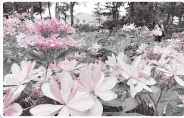
花の名前：ダンスパーティー

問 もりやま芦刈園 〒585-7133 守山市シルバー人材 センター ☎(583)2727 FAX(583)2750