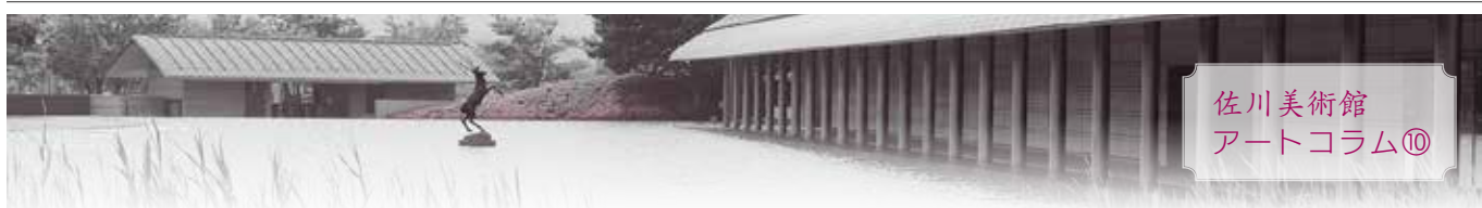
佐川美術館 アートコラム⑩