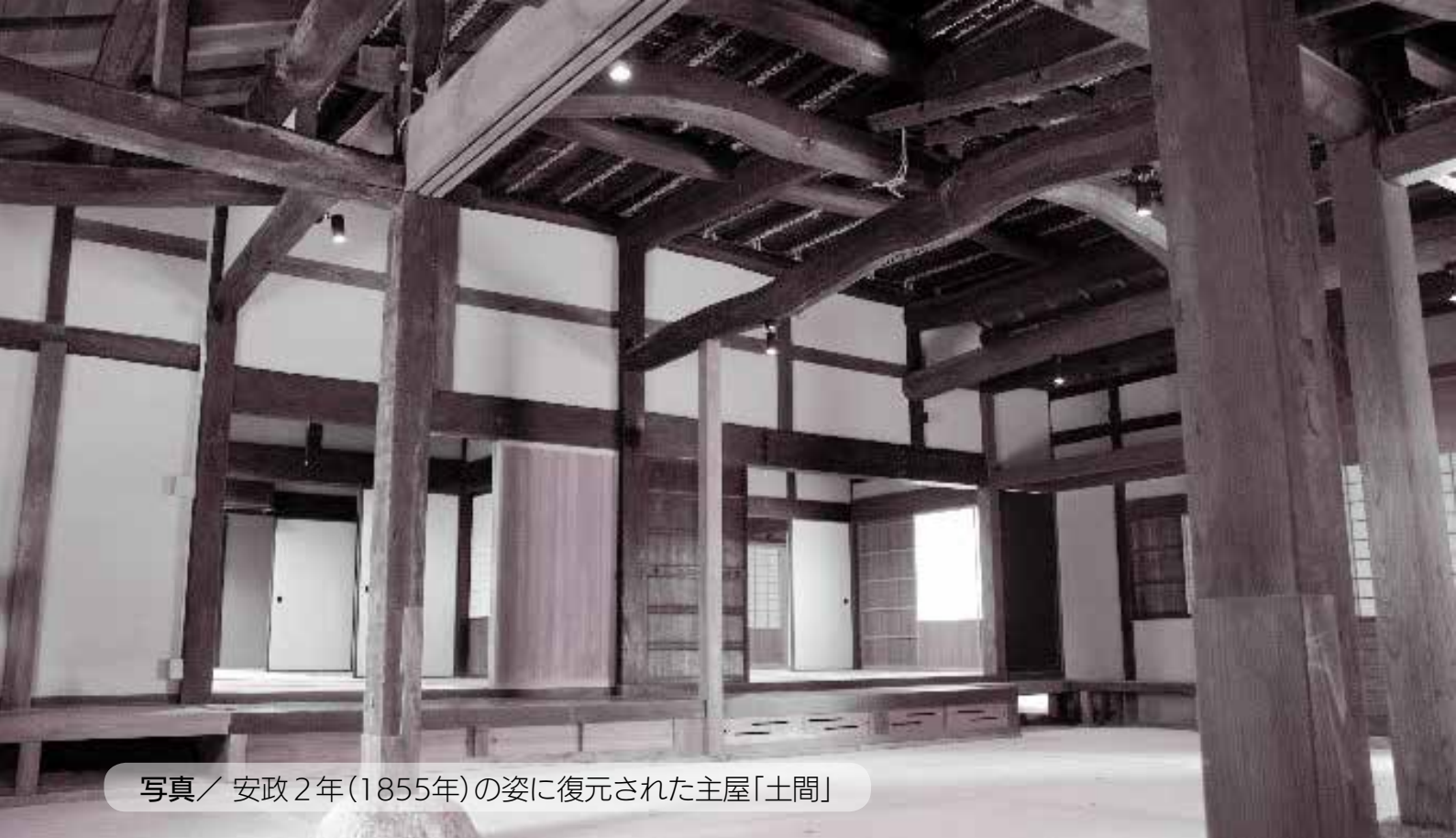
写真／安政2年(1855年)の姿に復元された主屋「土間」