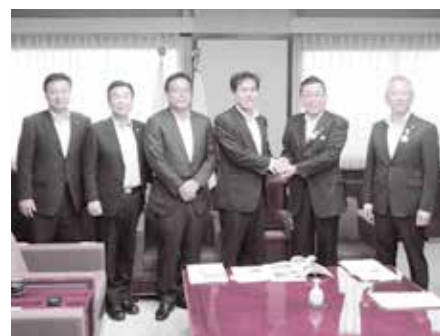
高山市との交流の様子

両市とは金森出身の武将金森 長近を通じて縁があり、今後は歴史・文化的なつながりを通じた交流を推進するとともに、災害時応援協定、教育や観光分野などでの連携について、積極的な意見交換が行われました。