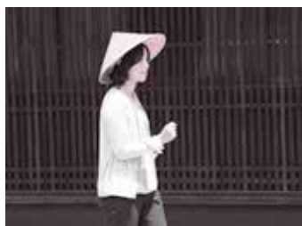
ウォーキングなどで健康づくり

市内の公共施設でパンフレットを取得→終了後、パンフレットに記載されている回収箱へ提出