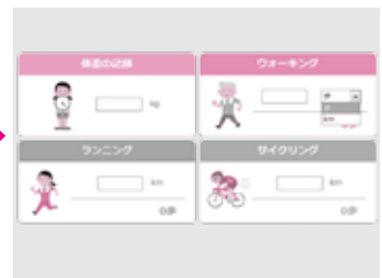
取り組み内容を入力