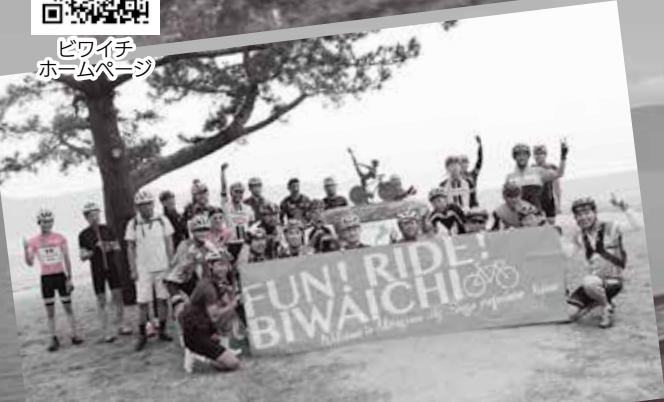
琵琶湖サイクリストの聖地碑前で記念撮影