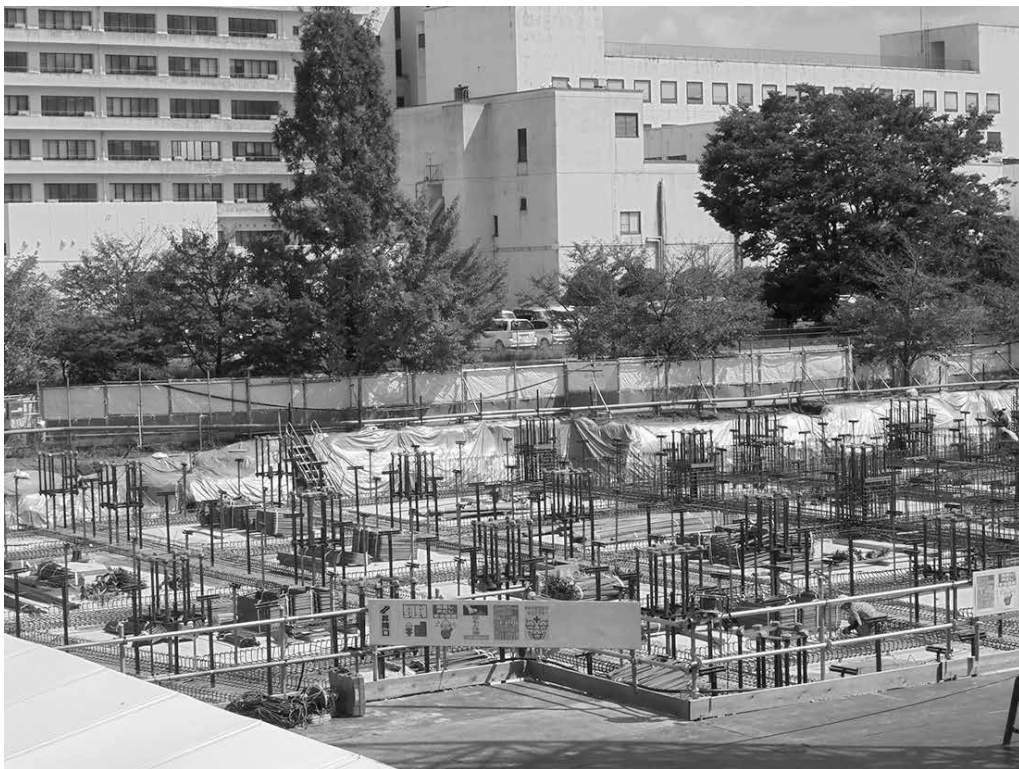
新図書館改築工事