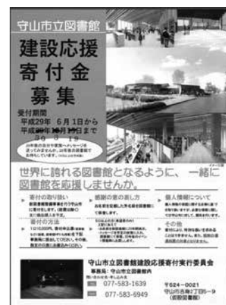
建設応援寄付金ちらし