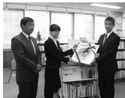
12月20日 絵本の贈呈式