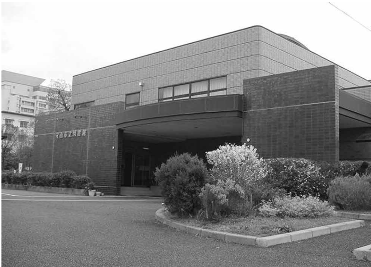
平成元年から平成28年8月