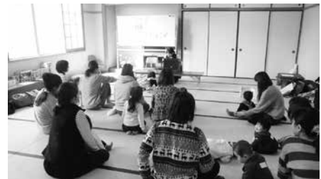
おやこほっとステーション(守山)