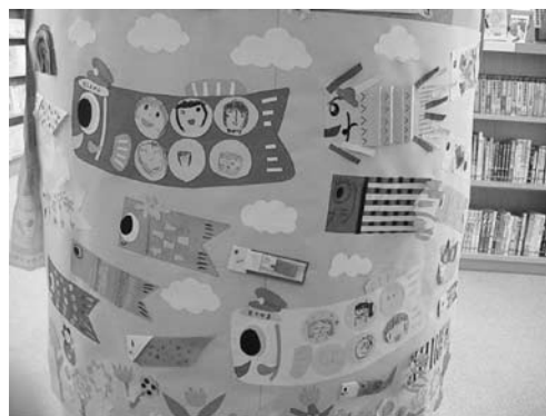
としょかんかざり隊！作品