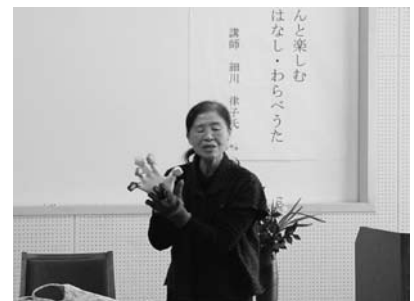
第2回児童図書研究講座