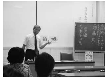
第1回児童図書研究講座