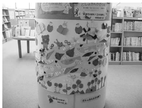
としょかんかざり隊！作品