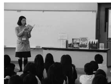
ブックトーク（玉津小）