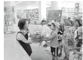
もりの風こども園