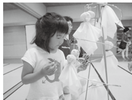
ルシオールアートキッズ フェスティバル