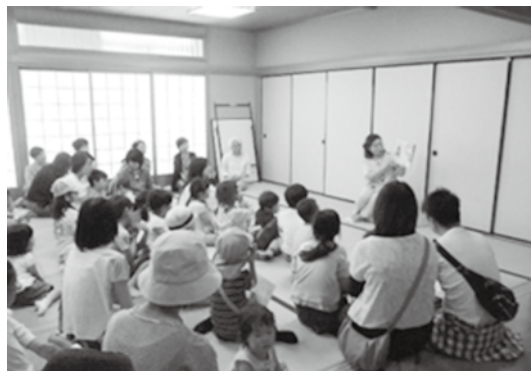
ルシオールアートキッズフェスティバル