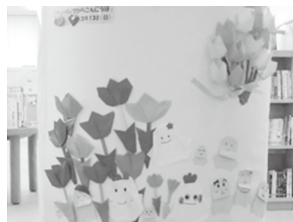
としょかんかざり隊！