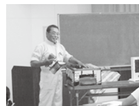
夏休みわくわく教室

子どもたちが図書館に来るきっかけを作り、体験を通して知的好奇心を刺激し、図書館の利用促進につとめる。