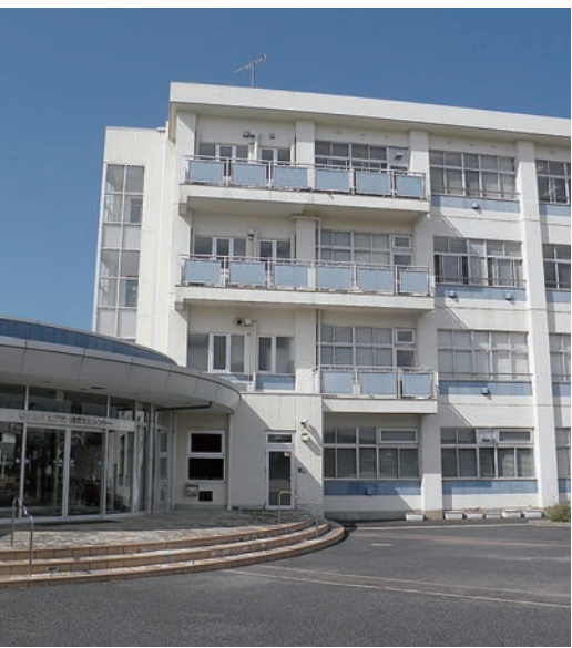
▲女子高跡地に開設したエルセンター