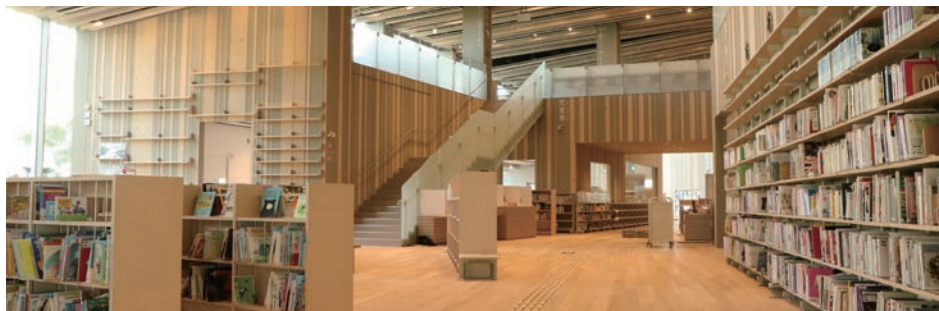
▲新しくできた図書館