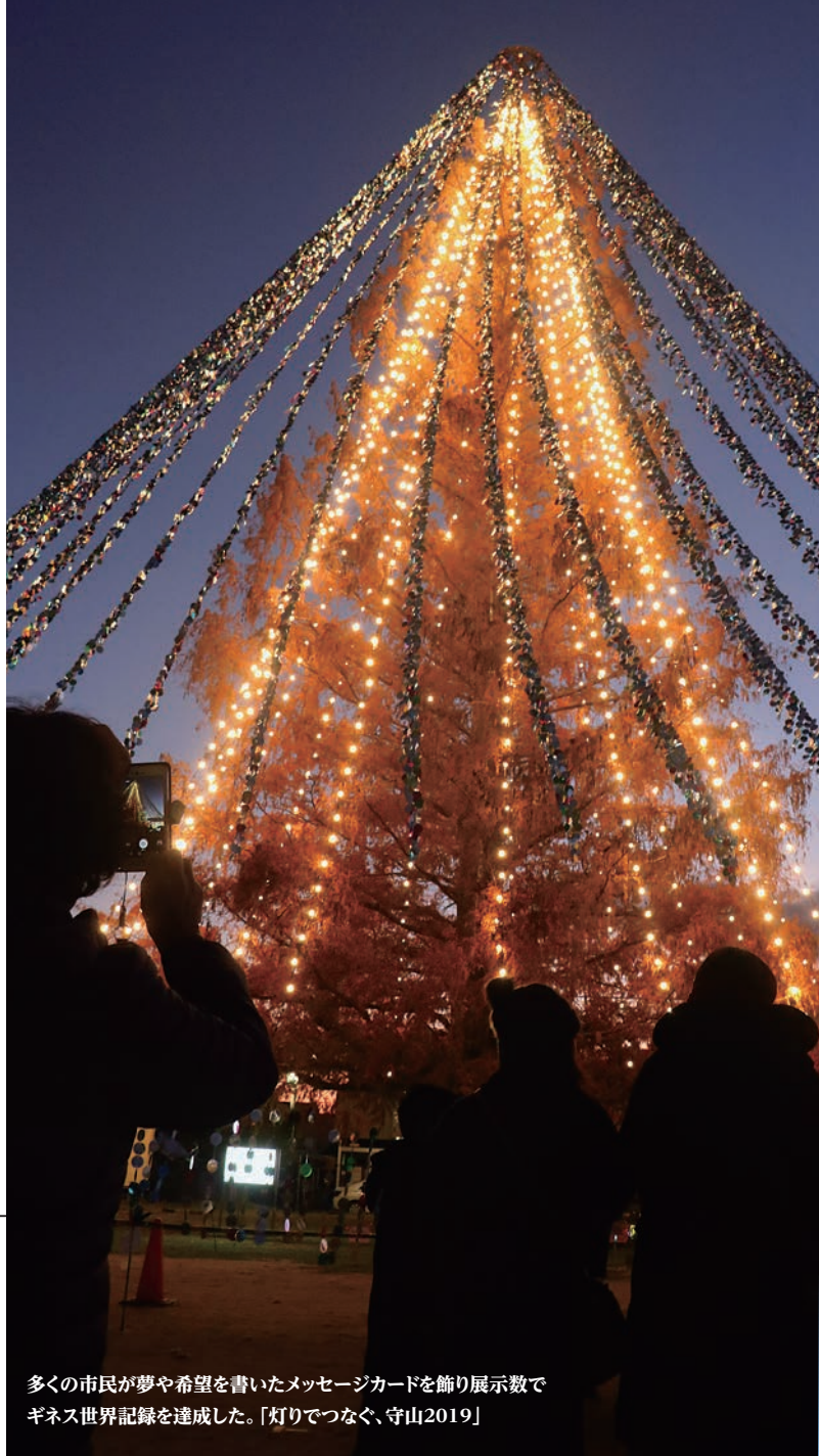
多くの市民が夢や希望を書いたメッセージカードを飾り展示数でギネス世界記録を達成した。「灯りでつなぐ、守山2019」