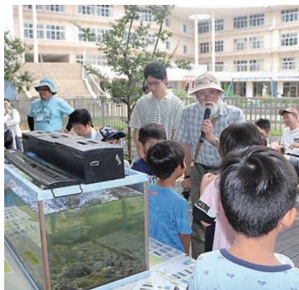
▲市民・子どもが集うあまが池プラザ

市民参画、市民公益活動が充実するなか、 中心市街地、学区の特色をいかした まるごと活性化事業を展開。 未来につなぐ公共施設の整備や活用も行われています。