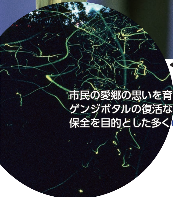
▲初夏に光る守山のゲンジボタル

市民の愛郷の思いを育む調和のとれたまちをめざして、ゲンジボタルの復活など、生活環境の改善や自然環境の保全を目的とした多くの取り組みがはじまりました。