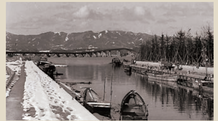
▲琵琶湖大橋と船着き場 [昭和40年代]