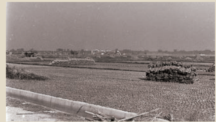
▲田園の風景 [昭和30年代]