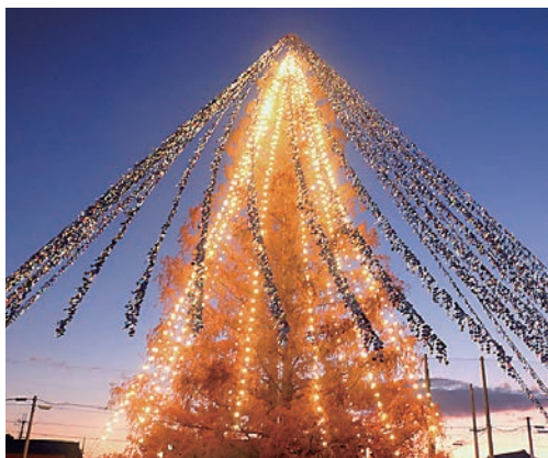
▲灯りであまが池、守山2019