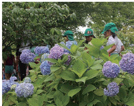
▲世界のあじさいを集めたもりやま芦刈園