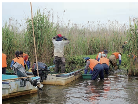
▲今も続く赤野井湾の環境保全活動