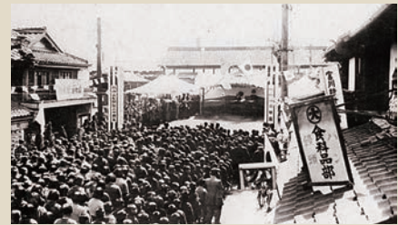
▲守山駅開設30周年記念式典 [1940(昭和15)年]