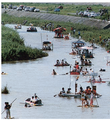
▲野洲川冒険大会いかだくだり