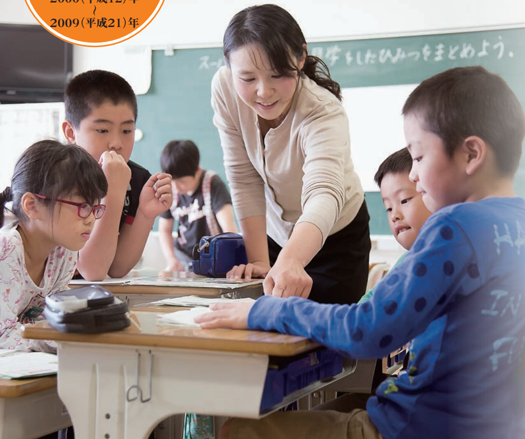
▲いきいきと授業を受ける少人数学級の子どもたち

The Garden City つなぐ、守山 2000 ↓ 2009 The 50th Moriyama City Histories