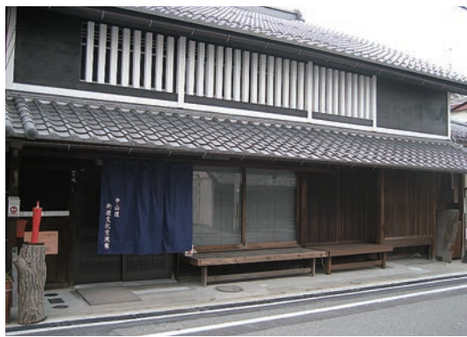
▲中山道街道文化交流館