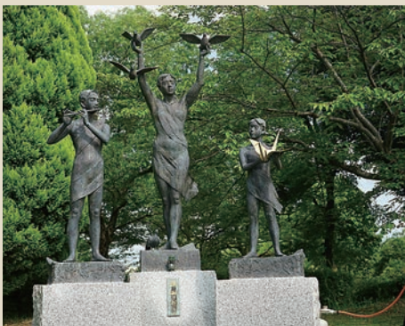
▲1997(平成9)年に設置された3体の彫像で、平和の音色にハトが羽ばたく様子を表現した平和モニュメント