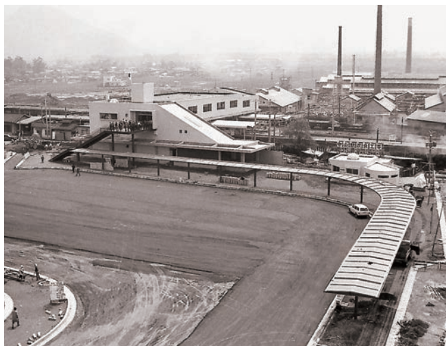
▲橋上駅に整備された守山駅