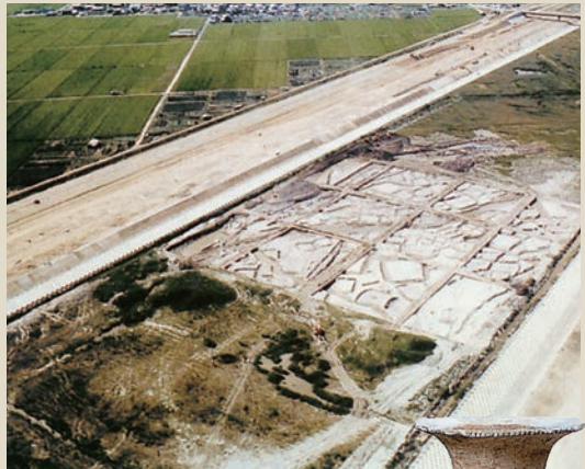
▲服部遺跡全景と出土品 [1985(昭和60)年]