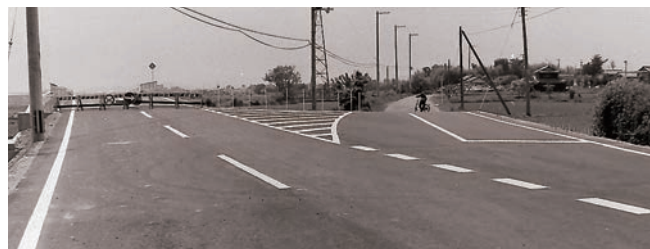
▲整備された幹線道路・県道146号欲賀守山甲線(山賀交点～銀座西交点)

市制実現の宿願を果たし、交通網・集落内道路・ 上下水道など市民の生活環境の整備を中心に、 都市づくりの基礎固めに邁進しました。