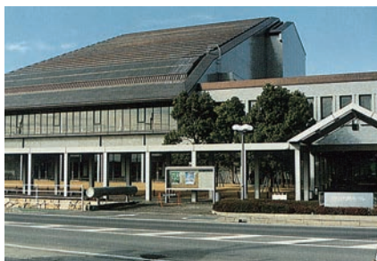
▲完成当時の市民ホール外観 [1986(昭和61)年]

市制施行10周年を記念して市民憲章を制定しました。 保健衛生・文化・スポーツなどの基盤・拠点となる施設を 市民のよりどころとして、まちづくりが前進しました。