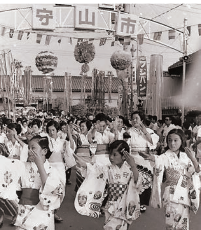
▲守山市制誕生を祝って守山音頭の振付が完成。夏の七夕まつりで初の総踊りが行われました