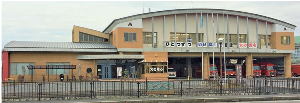
▲北消防署と併設されたコミュニティ防災センター[2003(平成15)年竣工]

2000 (平成12) 年 4月 市はたる条例と市情報公開条例を施行 市公文書館開館 平安女学院大学開学 7月 第4次守山市総合計画策定