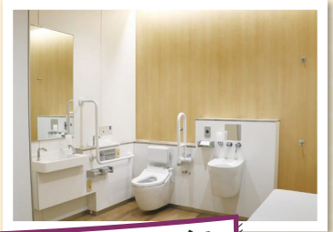
バリアフリートイレ