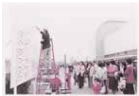
当時の市民体育館