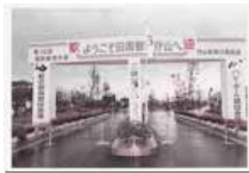
当時の市民運動公園