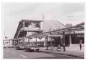
当時の守山駅 歓迎の装飾が施されています

昭和56年、「水と緑にあふれる若さ」をスローガンに開催された「第36回国民体育大会(びわこ国体)」。