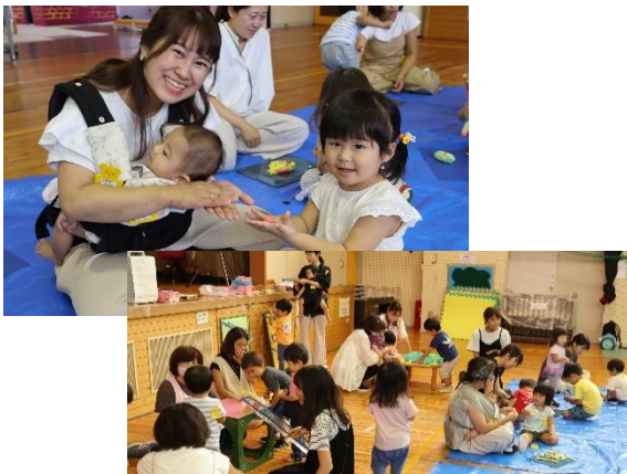
なかよしひろば「お絵描きあそび」10/2