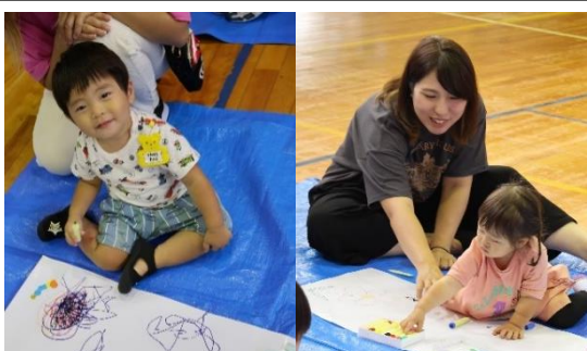
なかよしひろば「お絵描きあそび」10/2