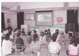
幼稚園で祭りのお話(古高鼓踊り)