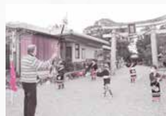
伝統文化こども教室(幸津川町)