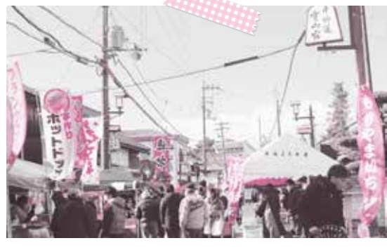
中世の市のにぎわいを今に伝える「もりやまいち」

さて、明日12月2日(土)開催の「MORIYAMA ソフトボールフェスティバル」では、日本女子ソフト