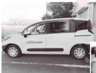
10月に車いす対応の車両(2台)を寄贈いただきました