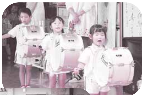
コンサートごっこ