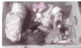
回収されたごみ(1回分)