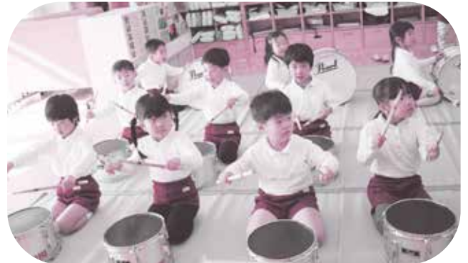
みんなで呼吸を合わせて、リズム遊び

本年9月に、滋賀を舞台にした大舞台「わたしHIGA輝く国スポ・障スポ2025」(令和7年)を前に、リハーサル大会を開催します。 43年前に行われた「びわ湖国体」では、カナリヤ鼓隊がJR守山駅前で演奏を披露して、全国から来市した選手を歓迎しました。今回は、軽快な太鼓のリズムと演技を今も受け継ぐ鼓隊を取材しました。