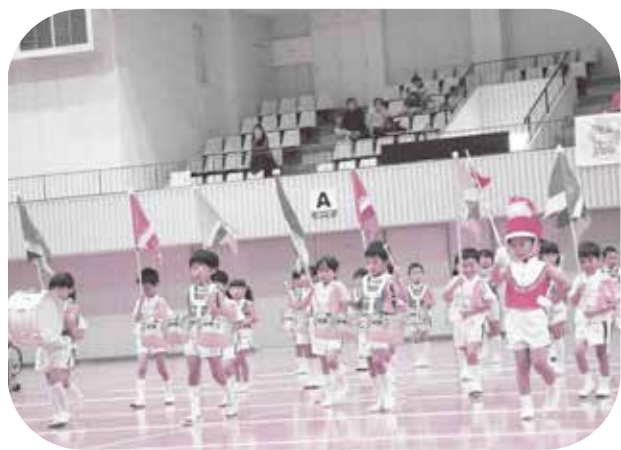
5歳になったらカッコいい行進もするよ(昨年運動会の5歳児たち)