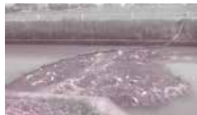
フェンスで止められた散在ごみ