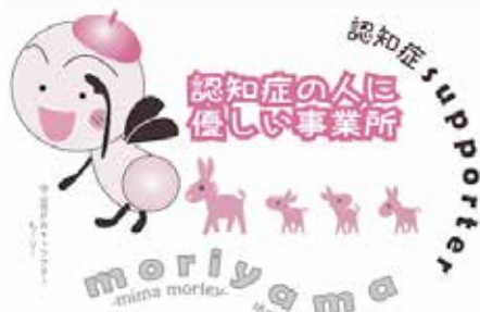
認知症みまもり事業所ステッカー