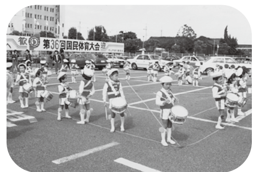
昭和56年国体でも鼓隊が活躍

大きな舞台は年に2回。スマイルコンサートという名前の音楽発表会で、4歳児は、保護者などたくさんのお客を前に、衣装に身を包み、いろいろな打楽