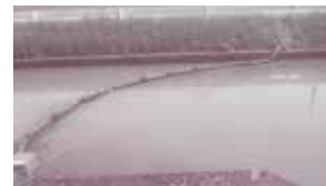
きれいになった金田井川