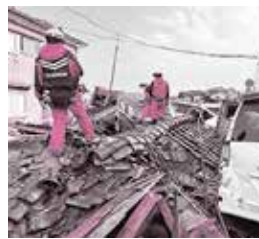
被災地で活動する湖南広域消防局(左)・守山市職員(右)