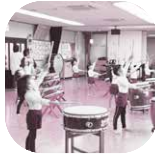
本物の楽器でリズム遊び