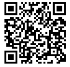
滋賀県獣医師会 ホームページ