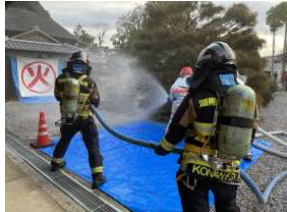
【消防団による放水】