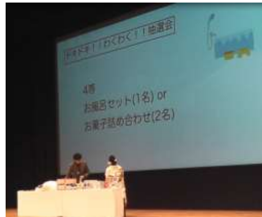
つどい「お楽しみ抽選会」