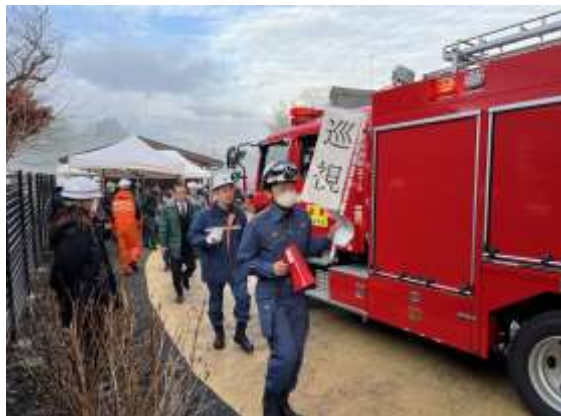
【訓練本部・来賓による巡視】