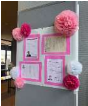
祝電・メッセージ