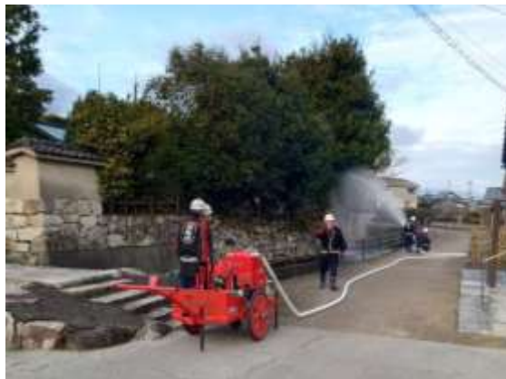
【自治会による初期消火】