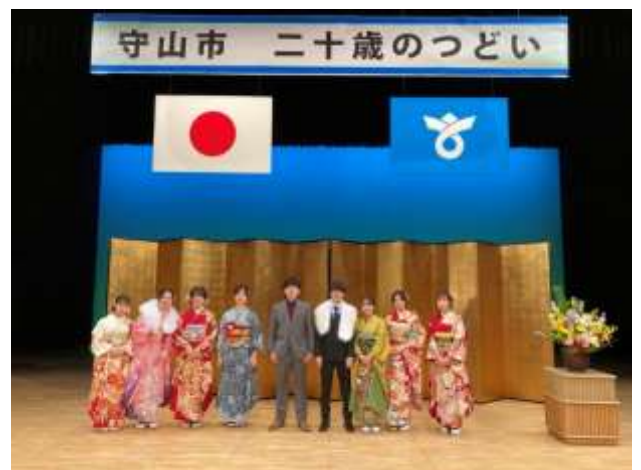
二十歳のつどい実行委員