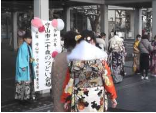
玄関前の様子（入場前）