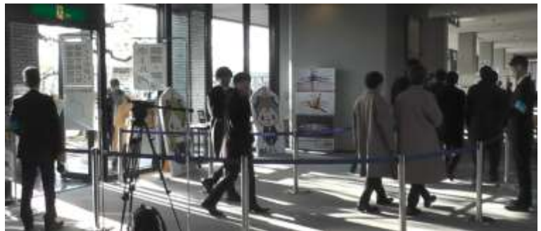
スタッフの態勢（入口付近）