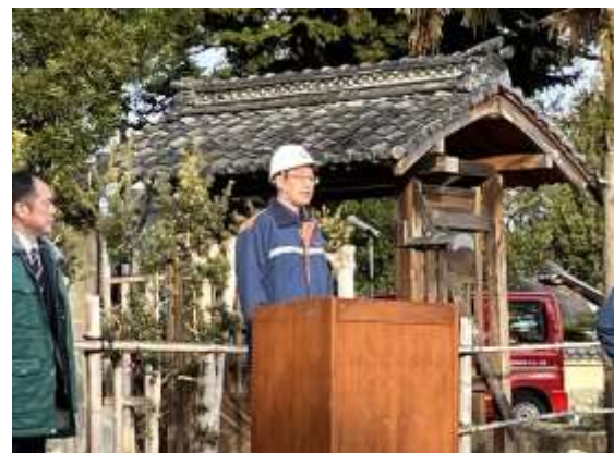
【市長（訓練本部長）訓示】