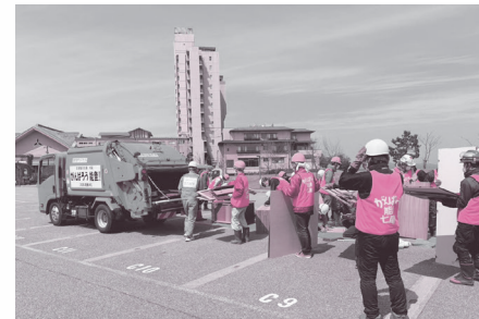
被災者の心に寄り添った災害ごみの搬入・分別