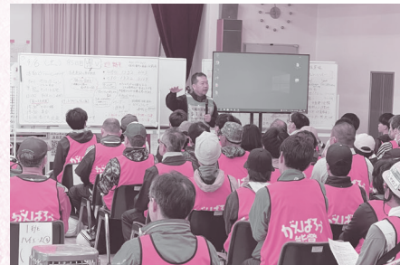
災害ボランティアのオリエンテーション

七尾市の災害ボランティアセンターの応援に行ってきました。本会では2人目で、今後の状況により派遣者を増やすことになるかもしれません。被災地への移動中の車窓から災害の爪痕が見られました。私は被災者とボランティアのマッチング業務を担当しました。ボランティアの活動は、被害を受けた自宅などの片付け、災害ごみの運搬などが主な内容です。1日に120人余りのボランティアが班に分かれ、約20件の依頼に対してワゴン車や2tトラック、軽トラックを配車していました。マッチング業務を通じて、ボランティアに来た方々の「被災者を助けたい、何かをしたい」という強い思いを痛いほど感じました。今回の経験を、本市での災害ボランティアセンター運営訓練などに活かしていきたいと思っています。