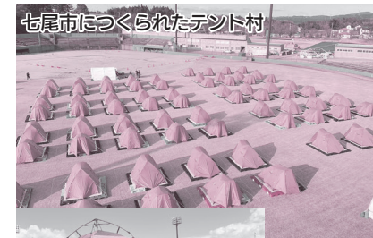
七尾市につくられたテント村