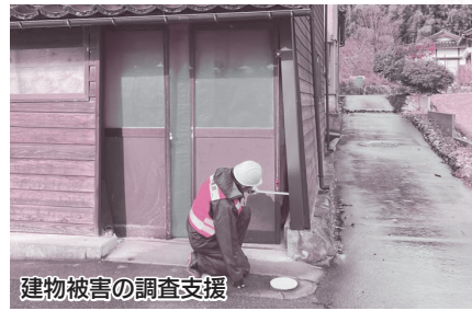
建物被害の調査支援