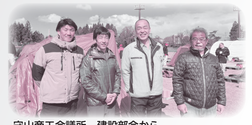
守山商工会議所 建設部会から 支援に行った皆さんとスタッフ