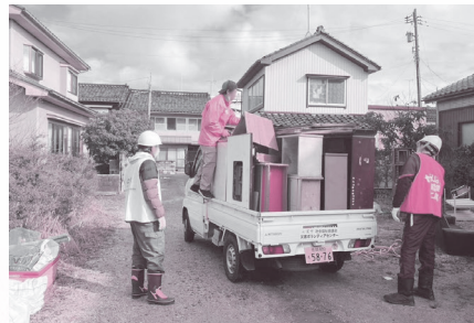
被災した建物からの運び出し