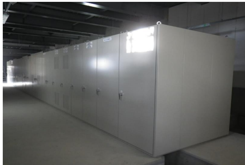
(6) 熱回収施設：プラント電気工事 高圧盤据付