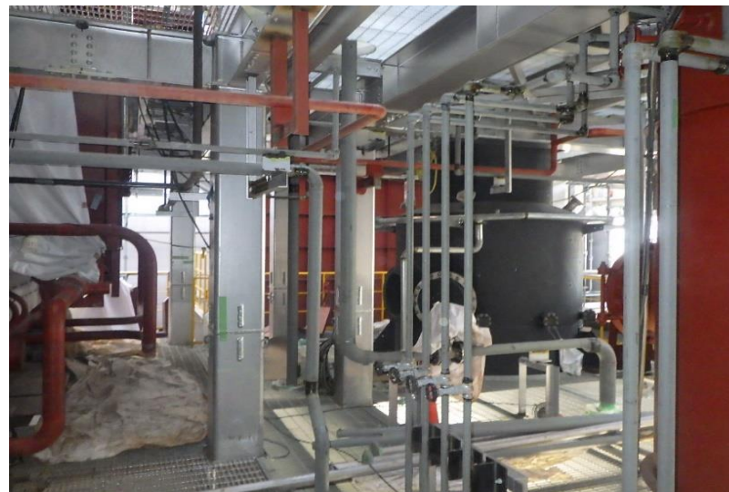
(8) 熱回収施設：配管工事