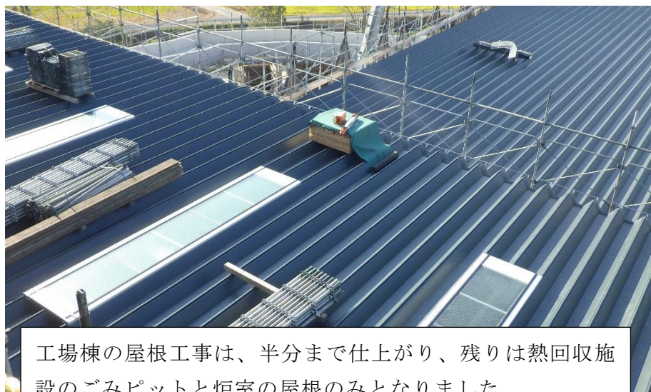
(3) 熱回収施設：プラットホーム屋根（折板）据付

工場棟の屋根工事は、半分まで仕上がり、残りは熱回収施設のごみピットと炉室の屋根のみとなりました。