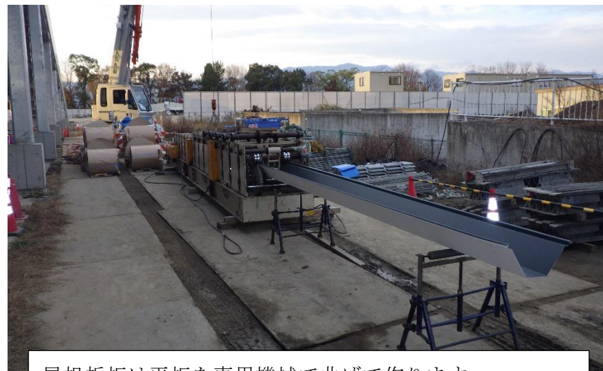
(2) 熱回収施設：屋根材（折板）加工