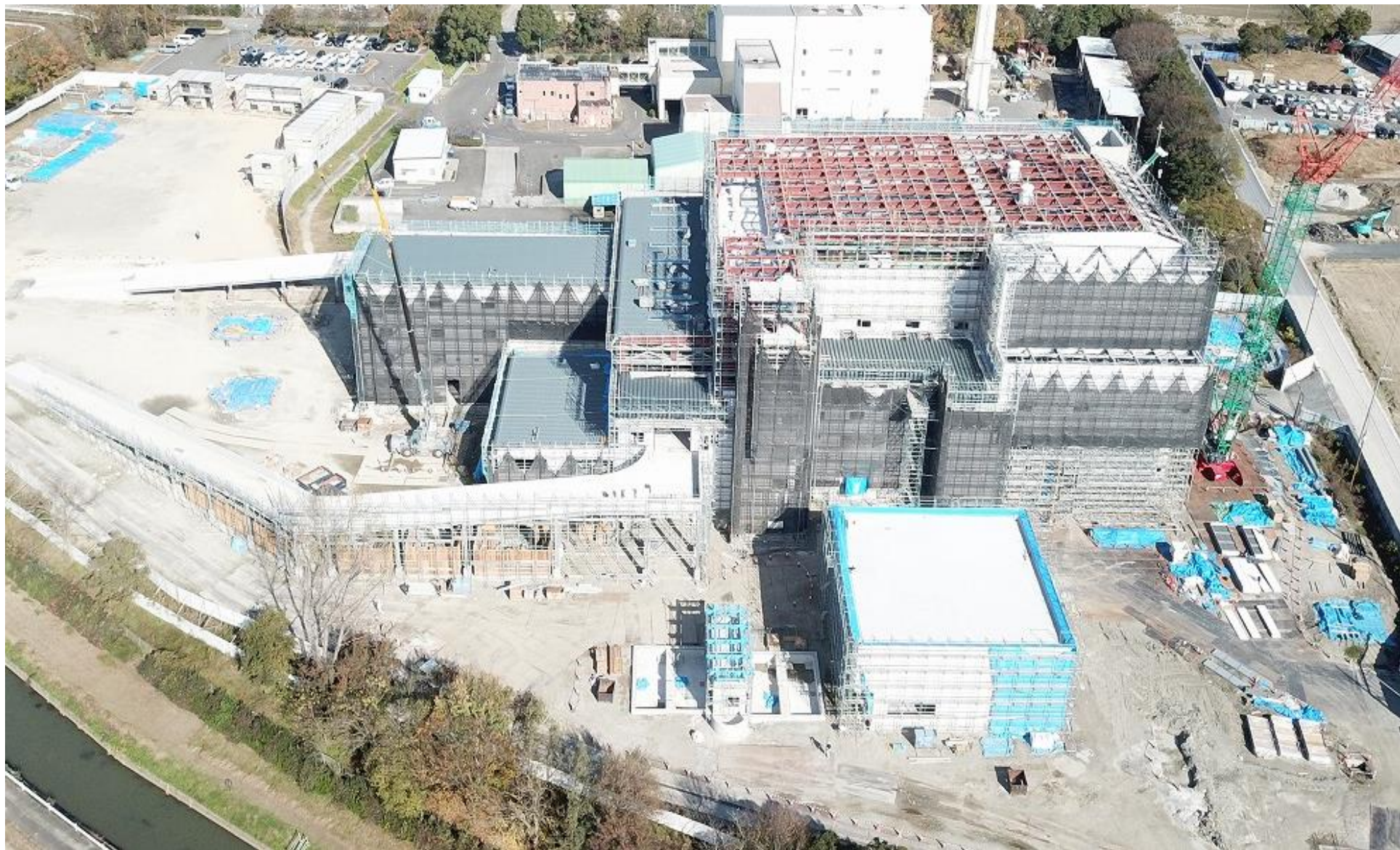
令和2年11月（2020年11月）の工事状況 11月30日撮影