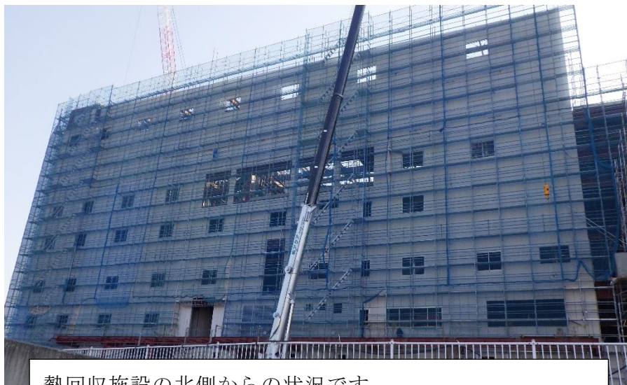
(1) 熱回収施設：外壁 ALC 工事