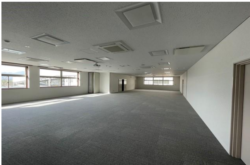
(3) 管理棟：研修室（2階） 内装仕上げ