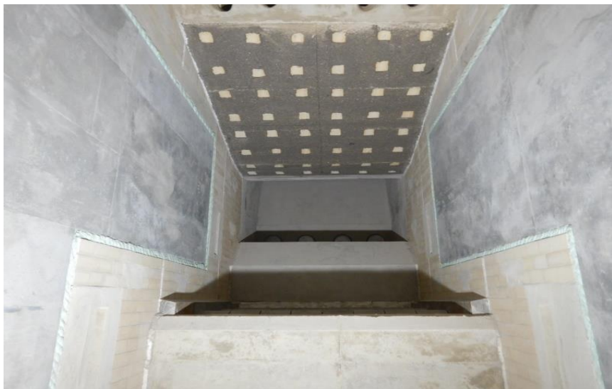
(5) 熱回収施設：焼却炉内耐火物施工