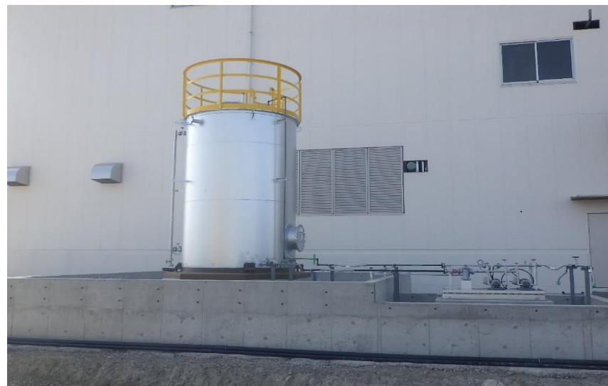
(8) 屋外：燃料貯留槽据付