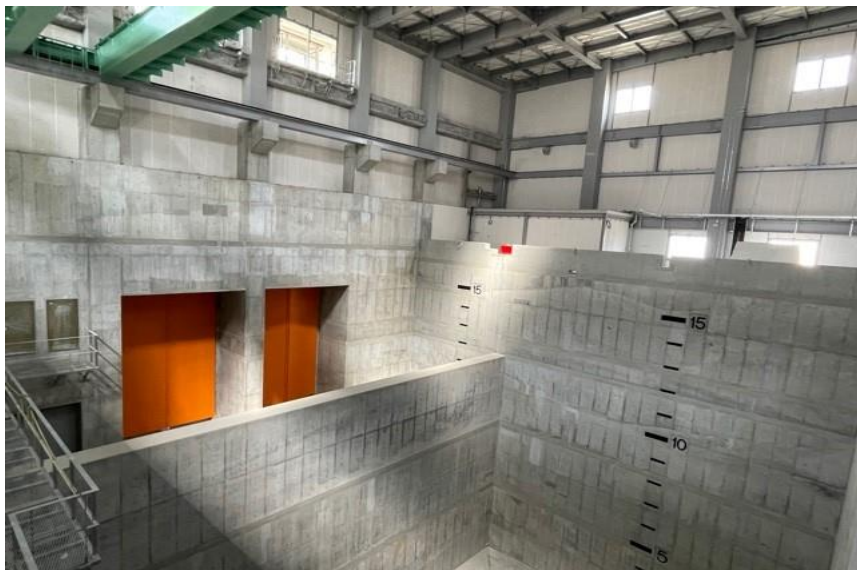
(1) 熱回収施設：ごみピットレベルプレート取付