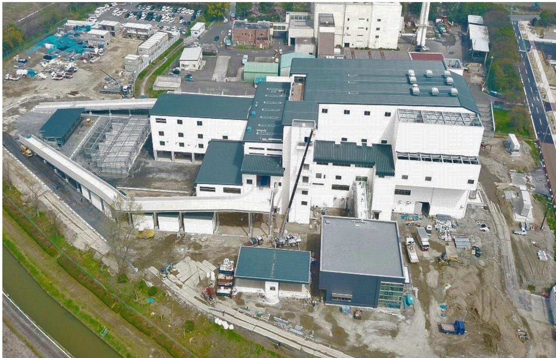
令和3年3月（2021年3月）の工事状況 3月30日撮影