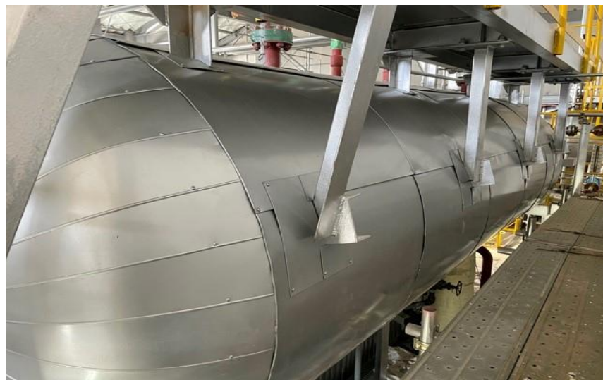
(6) 熱回収施設：ボイラドラム板金取付燃料貯留槽据付