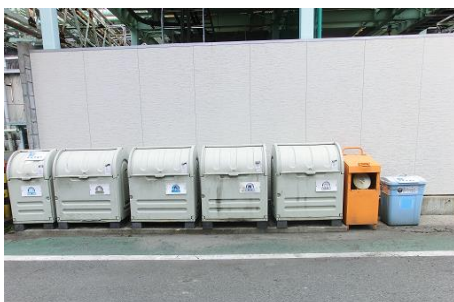
ゴミステーション