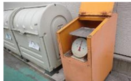
ゴミ箱へ投棄する前に計量します