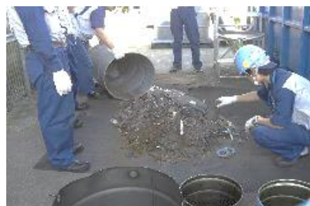
分別間違いで再度分別している様子